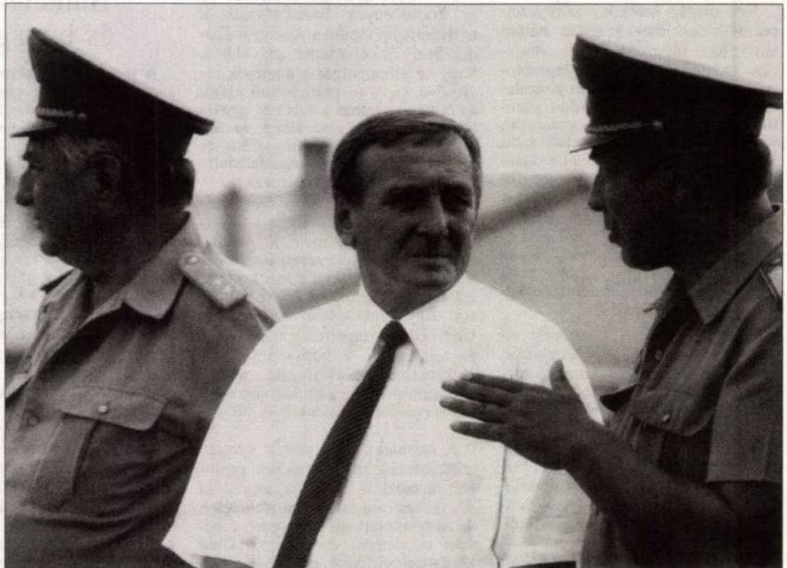
Honvédelem-irányítás civilben és mundérban (Keleti György miniszter katonai vezetőkkel)